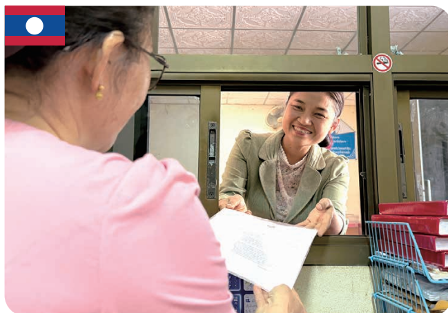
カムアン県保健局へ書類提出