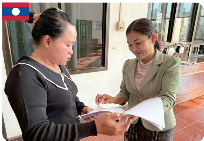
カムアン県庁へ新規プロジェクト内容の説明