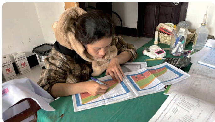
慎重に成長曲線に点を打つ保健センター職員

こういった「うまくいくために必要な課題」を一つひとつ発見しながら共有する中で、研修内容は日々アップデートされていった。