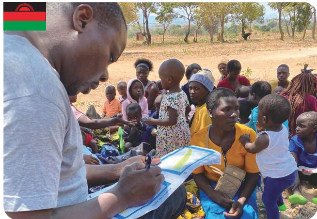
子どもたちの成長を母子手帳に記入するテドソン職員

ISAPHの活動を通して、現地がどのように変わってきているのか、マラウイ・ラオスの現地職員の視点からレポートしてもらいました。