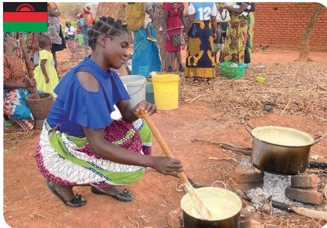
村のお母さんたちによるポリッジ（お粥）の調理実習