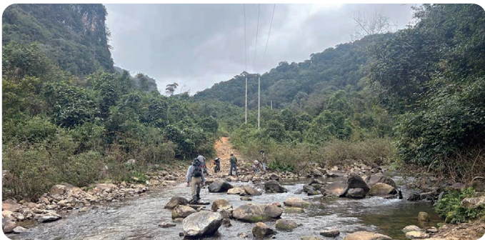
悪路を進み、目的地へ

初めてラオスを訪れたのは2025年2月。一気にその魅力にはまり、5月には東京代々木公園で開催されたラオフェスに参加。雨季のラオスをみたくて8月に再訪。そして今回12月。ISAPHの活動にプログラム評価の専門家として同行した。