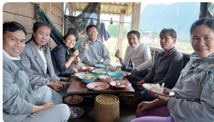
保健センター職員と昼食の様子

こうした機会を与えてくれたISAPHとお世話になった皆さまに、この場を借りて感謝申し上げます。また次回のプロジェクトにおいて専門家として参画する予定です。またお会いできる日を楽しみにしています。