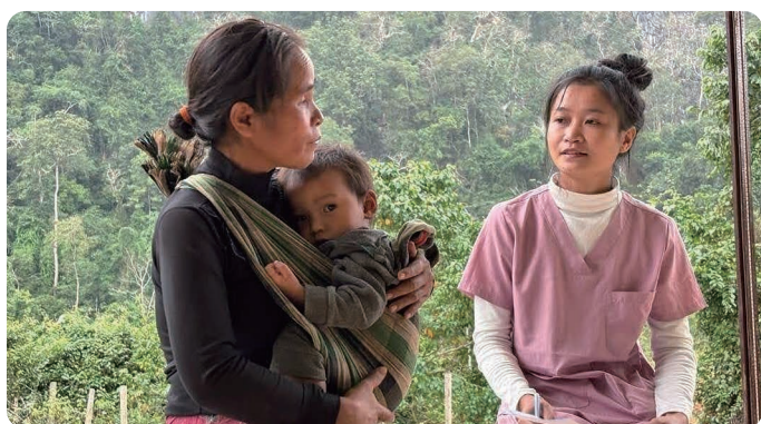
住民と視線を合わせて対話

健診は単なる測定会ではない。本人の健康増進を応援する機会であるべきだ。しかし、ともすれば「支援が必要な人を見つける場」で終わってしまう危うさもある。ISAPHは計器の提供にとどまらず、保健センター職員が栄養改善につながる健診を、主体的に実践できることを目指している。